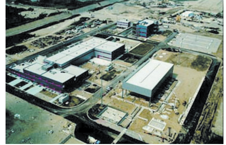
Международный аэропорт Малпенса, Милан 36.000 кВт 8 x YIA абсорбционных