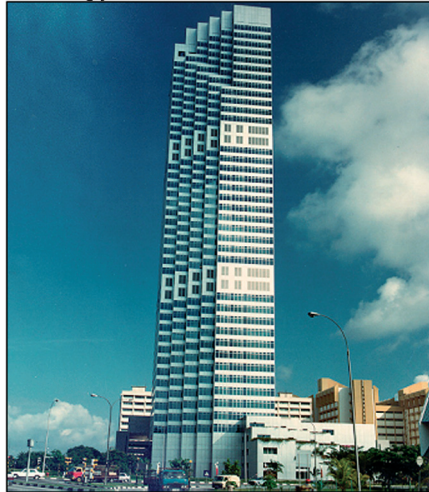
Здание правительства, Сингапур 7.010 кВт 6 x YK центробежных