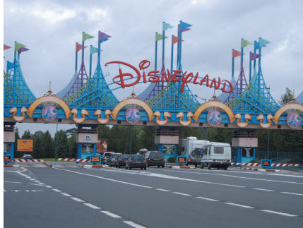
Евро Диснейлэнд, Париж 24.000 кВт 6 x YK центробежных