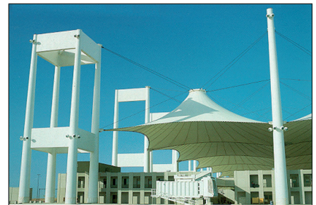
Международный аэропорт Jeddah 189.215 кВт 22 x OM центробежных 10 x YK центробежных