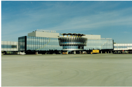
Международный аэропорт, Вена 1.500 кВт 1 YK центробежный