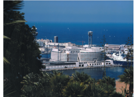
Национальный музей искусств и торговая выставка, Барселона 20.380 кВт 2 x YCAA воздухо-охлаждаемых 19 x YCAJ/YDAJ воздухо-охлаждаемых 12 x YRHP тепловых насоса 6 x AWHP тепловых насоса 4 x YCAS винтовых воздухо-охлаждаемых