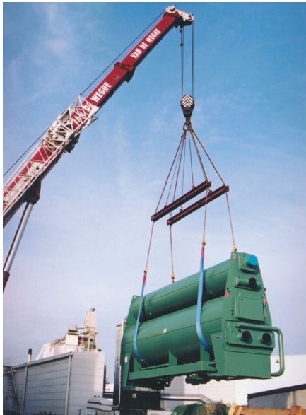
Здание Европейского Парламента, Брюссель 1.720 кВт 2 x YIA абсорбционных