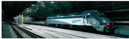
Пролив Ла-Манш 73.585 кВт 8 x OM центробежных