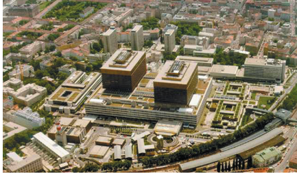
Центральная больница, Вена 15.900 кВт 6 x YK центробежных 4 x абсорбционные машины